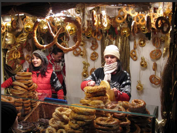
Preclíky na trhu Freyung